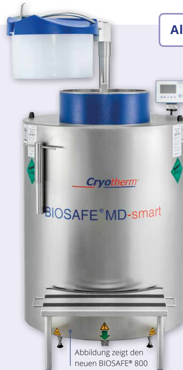
Abbildung zeigt den neuen BIOSAFE® 800