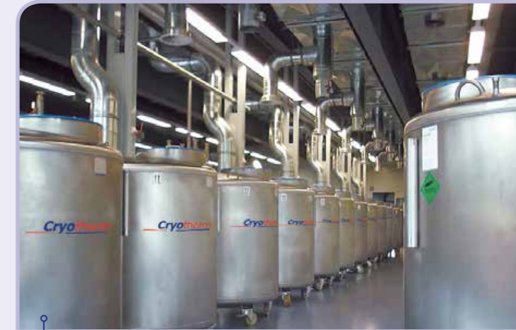
Cryobank mit mehr als 100 Cryobehälter.

Die BIOSAFE®-Systeme 500 bis 2400 sind bei minimiertem Verbrauch auf maximales Fassungsvermögen hin optimiert. In dem Bereich 500 Liter bis 2400 Liter und mehr können die Behälter über den seitlich angebrachten Behälterhals und das leichtgängige Karussell einfach beschickt werden. Die leichtgängigen Lenkrollen machen BIOSAFE®-Lagerbehälter mobil und Sie jetzt noch flexibler.