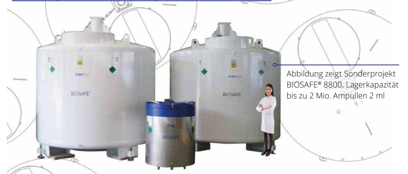
Abbildung zeigt Sonderprojekt BIOSAFE® 8800, Lagerkapazität bis zu 2 Mio. Ampullen 2 ml